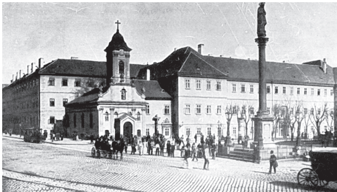
A Szent Rókus-kápolna és a kórház épülete a Monarchia korában

SAJÁT KEZÉN IS felfedezte a bomló szerves anyagot, és azonnal megértette, hogy kollegái és ő maga is közvetlenül felelősek a kismamák haláláért. A megoldás is világosnak tűnt: „Bármily fájdalmas, bármily nyomasztó is az ilyen beismerés, nem a letagadásban rejlik