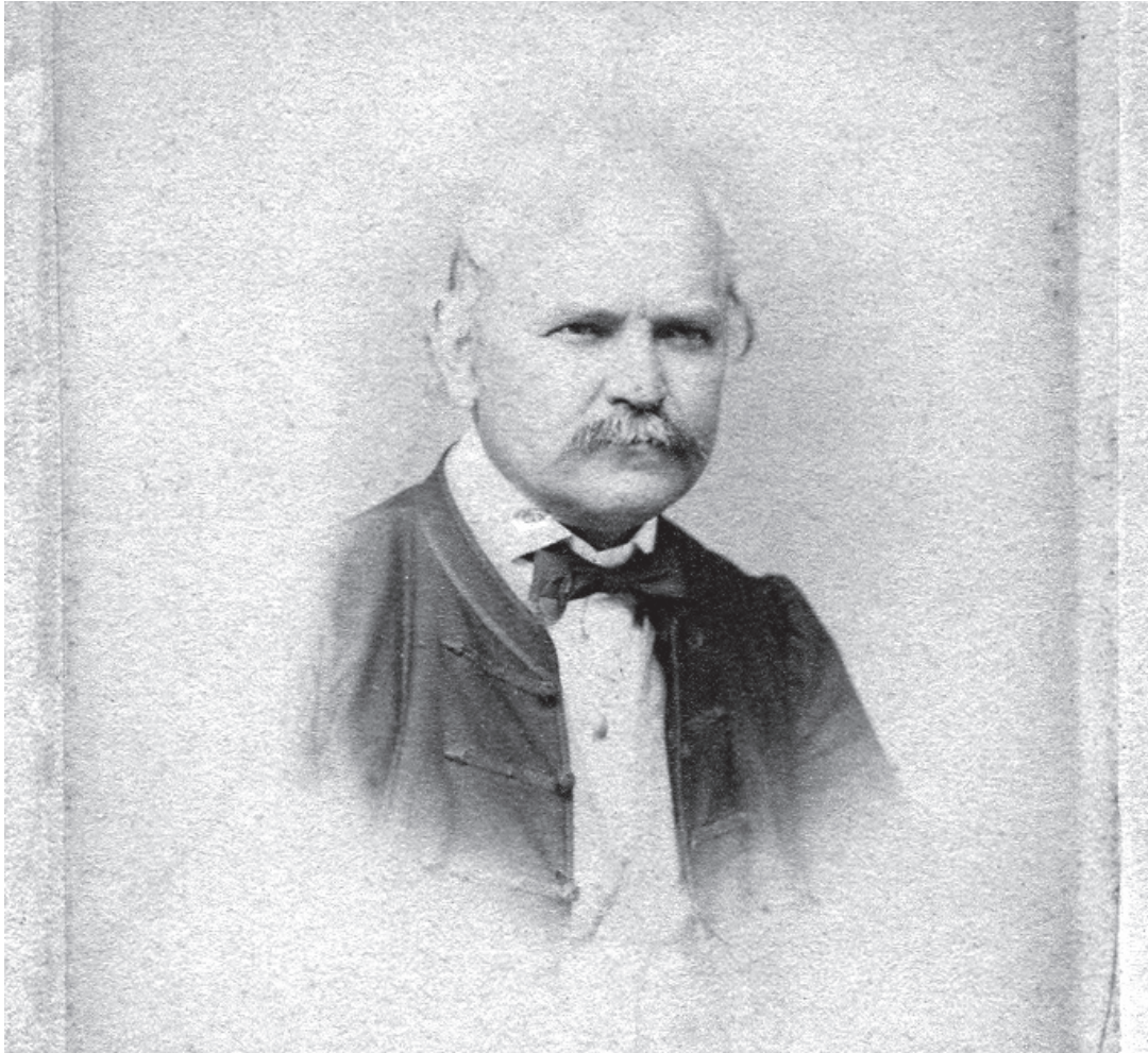
Nemcsak kollégáit, önmagát is okolta. A képen csak 43 éves

gúnyos ellenvéleményen kívül semmilyen érdemi reakciót nem kapott rá. Egy kritika a „ hullamérgezés Koránjának ” nevezte a könyvet, amelynek fantaszta szerzője „ harca kél, hogy tüzzel-vassal megtérítse a hitetleneket ”. Semmelweis elkeseredett az újabb elutasítás miatt, és továbbra is önmagát vádolta